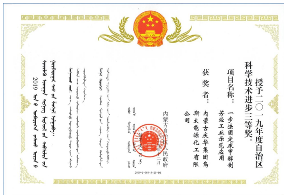
内蒙古自治区 科学技术进步三等奖