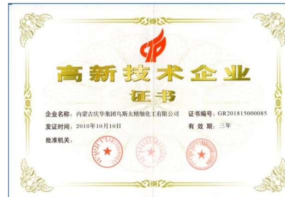
国家高新技术企业证书

公司实施的煤焦油加氢工业示范项目获得2018年自治区科技进步二等奖，甲醇制混合芳烃项目获得2019年自治区科技进步三等奖，乌斯太精细公司、能源公司被评为国家级高新技术企业。