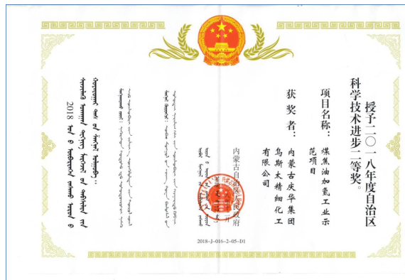
内蒙古自治区 科学技术进步二等奖